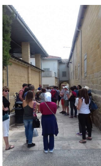
Un giorno di visita alla città di accoglienza.

Queste reti hanno preso varie forme e si sono basate sulle circostanze individuali di ciascun paese e sui bisogni espressi delle donne migranti.