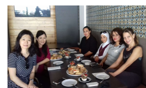
@ CARDET, CY, Fare colazione assieme