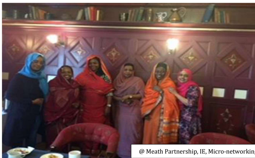
@ Meath Partnership, IE, Micro-networking