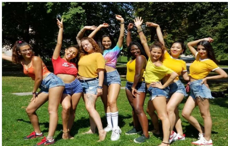
@ JAW, AT, Micro-networking

I temi comuni di discussione stabiliti dalle reti hanno incluso: