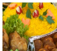
@ UPIT, RO, Evento di cucina