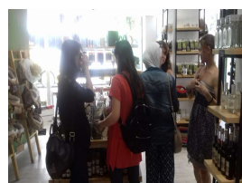
Visita al negozio di spezie