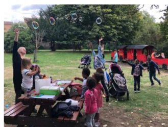
@ LU, UK, Picnic internazionale