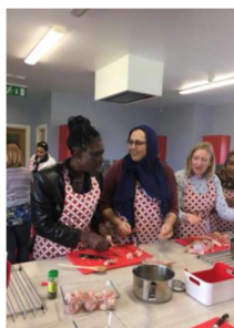
@ Meath Partnership, IE, Cucinare insieme