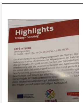
@ JAW, AT, INTEGR8 Cafe

Sono inoltre in programma piani per promuovere e reiterare l'attività formativa rivolta alle donne migranti identificate attraverso le micro- reti sociali.