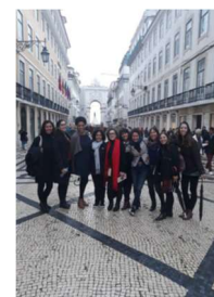
@ ISQ, PT, Un giorno al museo