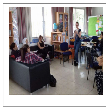
@ CARDET, CY, Discussione ispiratrice

Per tenerti aggiornato sulle attività del progetto visita il nostro sito Web